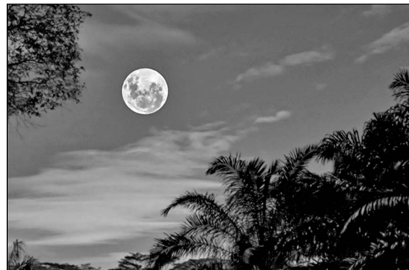
Full Moon at Night

I Advertisements, or ads, are part of our world. We see them in newspapers, on buses and on huge signs on the roads. But what about seeing ads and messages in space? Imagine seeing a poster in the night sky with Happy Birthday on it. Or, imagine that you want to look at the stars but instead, high in the sky you see an ad for a new shampoo or a popular running shoe. Soon we may have messages and ads like these high in the sky, especially at night. Companies will want to use this technology so that millions of people will be able to see ads and messages from anywhere on Earth.