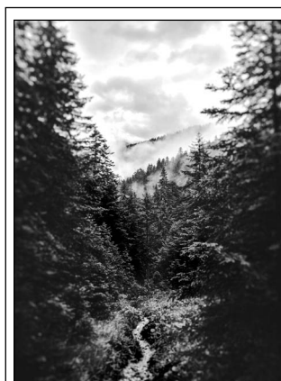
Forest Mountain Trail