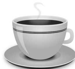
Wikimedia Commons, coffee cup icon, Open Clip Art Library, public domain