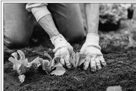
Planting Young Plants

I In the past few years, people started planting community gardens. More and more people are finding land in their neighborhoods and growing gardens. They invite their neighbors and friends to join them. Together they plant fruit trees, vegetables and flowers. These gardens are popular today because people want to do things outside their homes. Also, many people want to grow their own fruits and vegetables. In addition, some people think it's healthier to eat the things that they grow instead of the things that they buy.