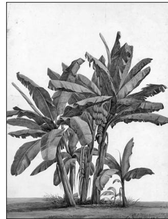
Banana Trees painted by Louise von Panhuys

IV Another advantage of banana leaves is that they are cheap. Banana trees grow in many places around the world, so their leaves are easy to get. We can't always use them instead of plastic, but sometimes they are a great alternative.