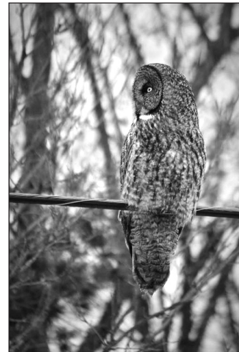
Gray owl turning its head