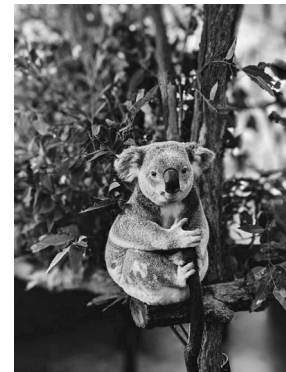
Koala in a Tree

V Dr. Lang explained, "We put a radio-chip on all the koalas that the volunteers rescued. This is because experts say that in the future there will be big fires again in Australia. In times of danger, it will be easier for volunteers to find the koalas that have a chip."