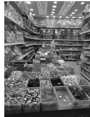
Candies in open boxes by Ehud Maimon

20 V Did Sweet Day work? People's teeth really improved but Professor Hansen says that it happened for other reasons. "The first reason is that doctors have new ways to take care of people's teeth. Also, today people everywhere want to have less sugar in their food. They know that too much sugar is not healthy in general, and not only for their teeth!" It is interesting to learn that although Swedish people love candy and have their Sweet Day, they eat less candy than people in Germany, Holland or 25 the USA.